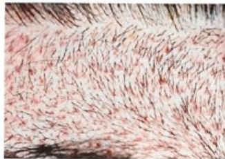
7 dní po transplantácii vlasov

pretože štepy vlasov sa vkladajú v smere rastu vlasov nachádzajúcich sa v tej oblasti. Celý proces hojenia a rastu je pomerne rýchly. Pri každej nasledujúcej kontrole u ošetrojúceho lekára je vidieť veľký pokrok a celý proces rastu z týždňa na týždeň.