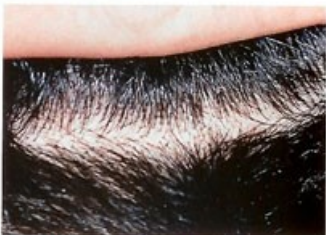
6 mesiacov po transplantácii vlasov

Po ukončení celého procesu nie je potrebná žiadna špeciálna starostlivosť o vlasy. Transplantované vlasy sú vaše vlastné a preto môžu byť rovnako strihané, farbené a inak upravované ako ostatné vlasy. Teraz sa už nemusíte báť vstúpiť do kadernického salónu a nábehnúť na nové vlasové trendy.