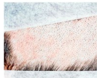
darcova oblasť pred odobratím štepy

Pri procedúre sa k vyňatiu vlasov od pacienta nepoužíva skalpel, nezostávajú žiadne jazvy na hlave pacienta, výsledok je prirodzený, pretože štepy sú ešte menšie ako v doterajších metódach. Vyberajú sa totiž pomocou veľmi malej, špeciálne na tento účel upravenej ihly, nie väčšej ako je ihla použitá pri obvyčajnej podkožnej aplikácii liekov.