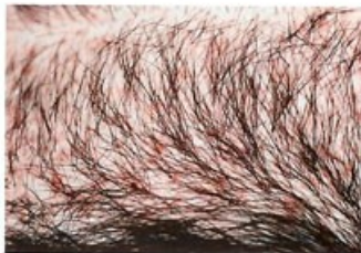
14 dní po transplantácii vlasov