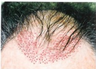
prijímateľova oblasť po ukončení techniky dierovania

Po odobratí šteпов neostávajú žiadne jazvy, iba malé chrastičky, ktoré po pár týždňoch zmiznú a miesto transplantácie nie je vôbec rozoznateľné. Po dokončení prvého kroku odobratia šteпов sa umŕtvi prijímateľova oblasť pokožky a predprípravi sa na vkladanie šteпов. Do umŕtvenej pokožky sa viacerými technikami dierovania pripravujú nové vlasové vačky, do ktorých sa budú vkladať vlasové štepy.