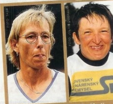
Dôkaz: Legendárna tenistka Martina Navrátilová (50) a olympionička Elena Kaliská (36) majú mužskejšie črty a vyzerajú staršie.